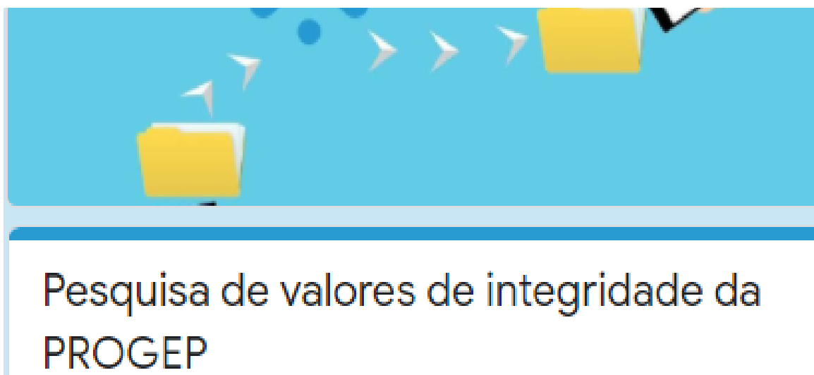
Figura 4 - Capa do formulário da Pesquisa de valores de integridade da PROGEP